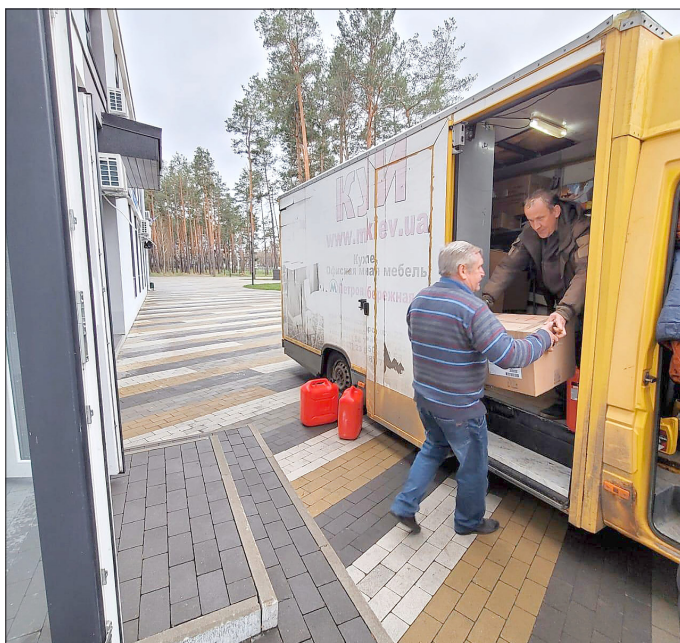
Im Krankenhaus Bilohorodka bei Kiew werden die Hilfsgüter aus dem Südeichsfeld entladen.

Inzwischen ist das Spendenkonto weiter angewachsen, so dass ein weiterer Hilfstransport aus dem Südeichsfeld folgen kann, so Günther. Auch kämen täglich Zusagen für weitere Sachspenden, um das Leid der Menschen in den Kriegsgebieten der Ukraine lindern zu helfen.